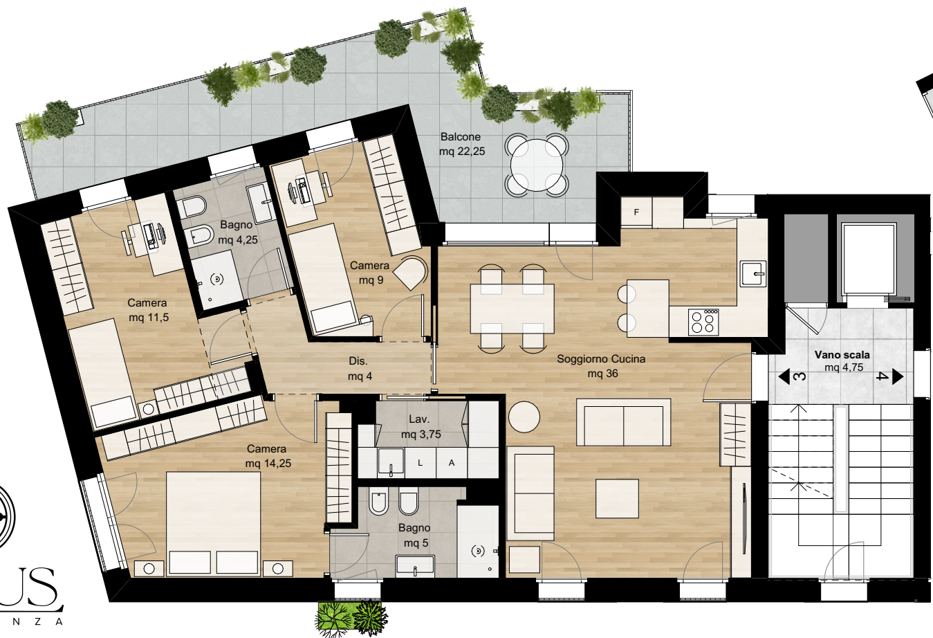
Piano Primo (Scala 1:100)