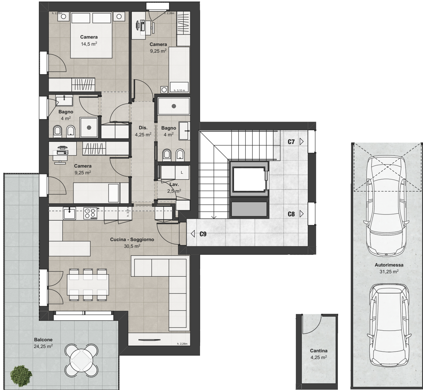
Piano Secondo (Scala 1:100)