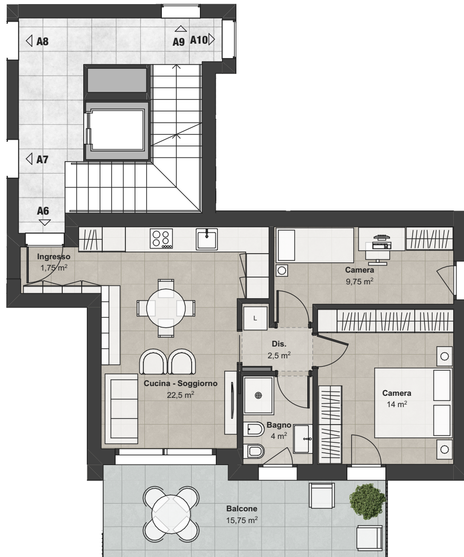
Piano Primo (Scala 1:100)