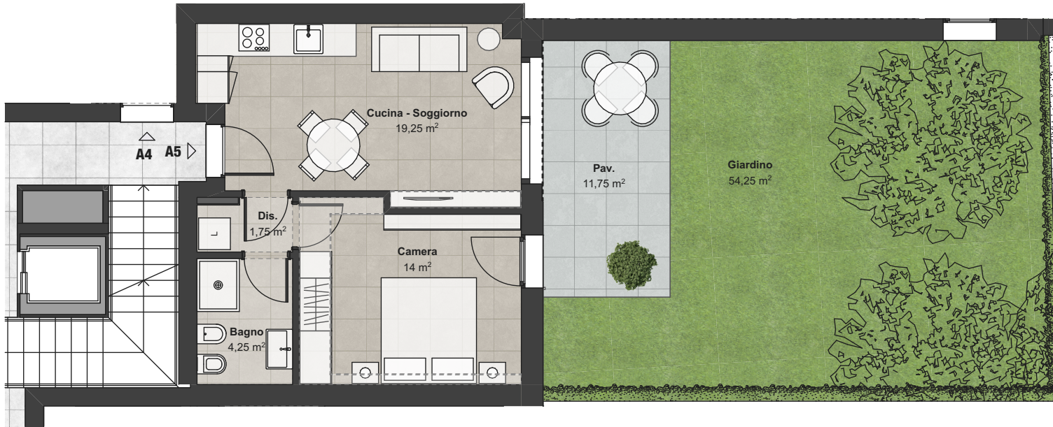
Piano Terra (Scala 1:100)