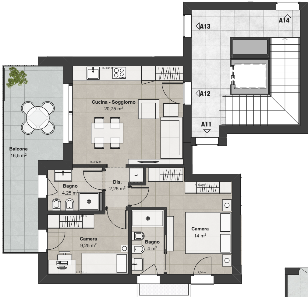
Piano Secondo (Scala1:100)