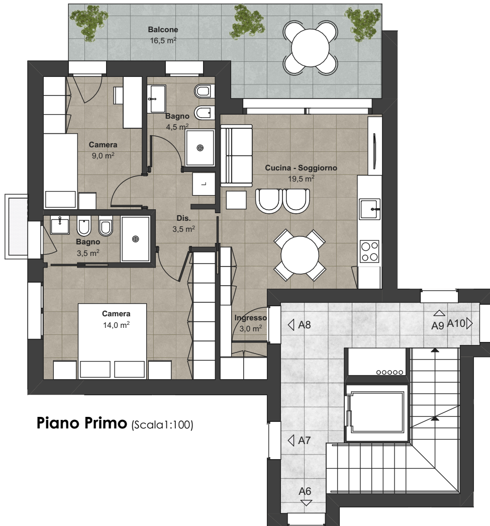
Piano Primo (Scala 1:100)