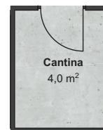
Cantina 4,0 m²