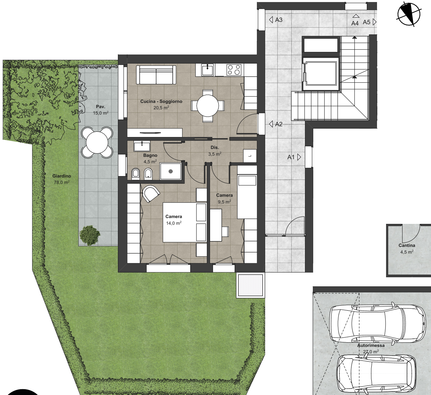
Piano Terra (Scala:1:100)